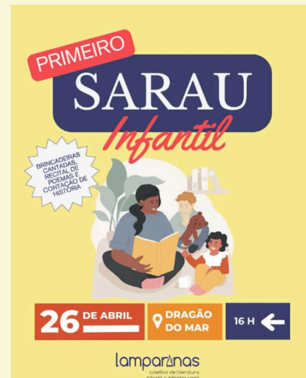
Abril - Sarau Infantil