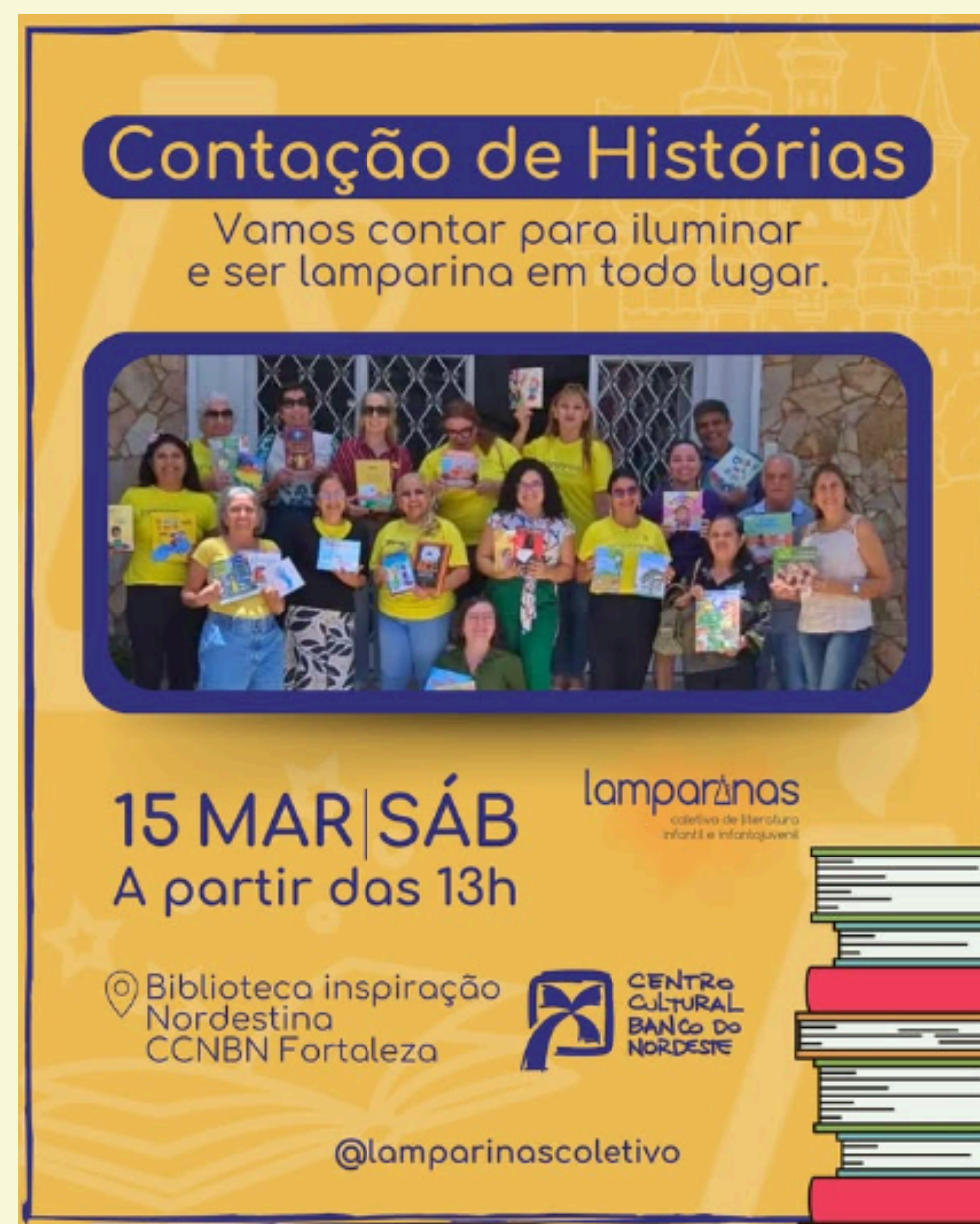
Mar - Contação de Histórias no BNB