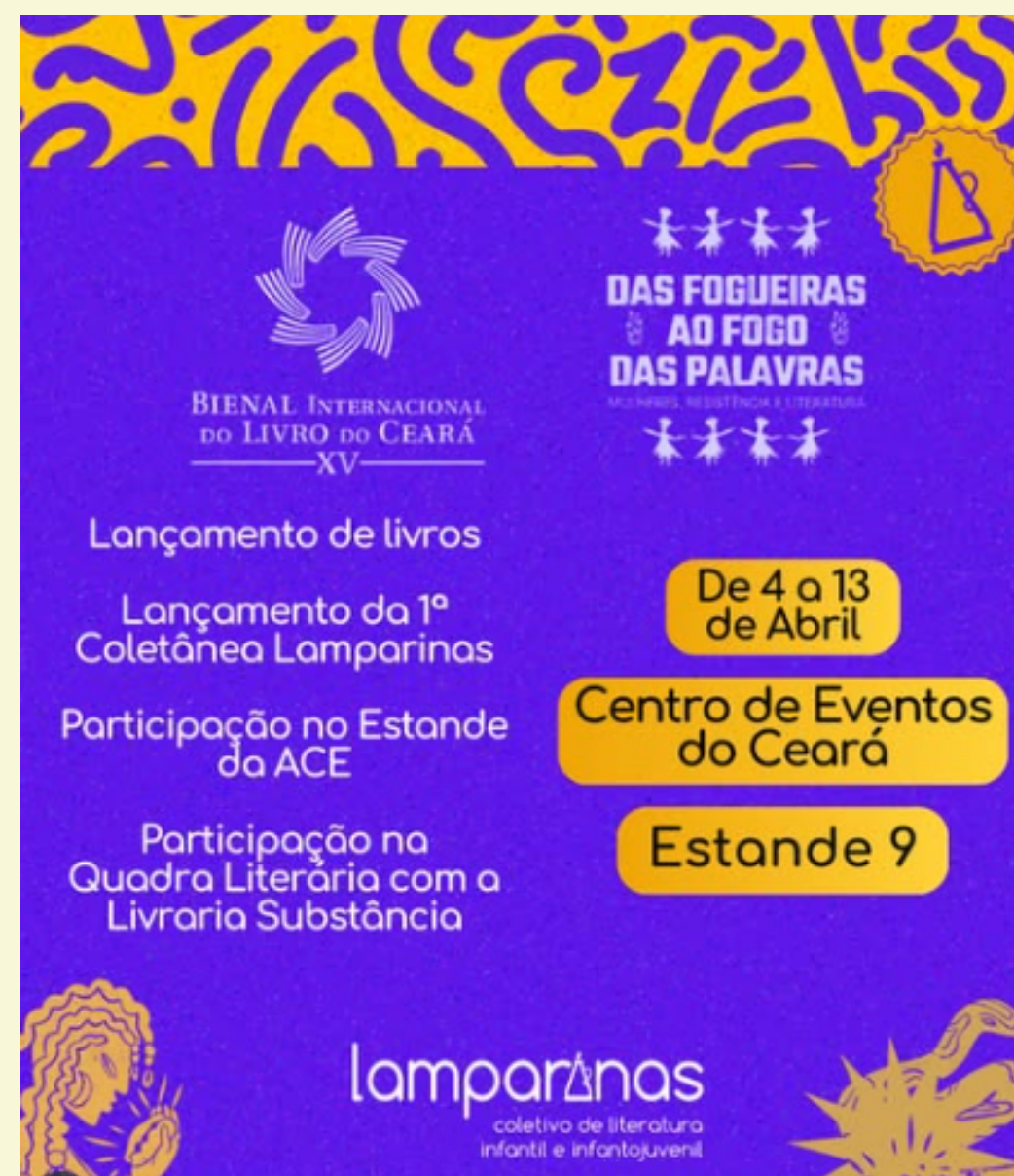
Abril - Participação na Bienal do Livro