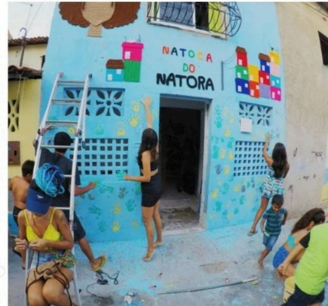
Crianças e adolescentes da favela fizeram parte da intervenção urbana no

"A mulher negra é a base da comunidade inteira, as pessoas devem ter consciência disso. Existe uma importância em tratar não só o povo negro, mas a mulher negra. O feminismo vem tomando um espaço muito massa de fala, mas é necessário um feminismo negro porque não é a mesma coisa", avalia. "A mulher branca lutou pelo direito ao trabalho, mas a mulher negra sempre teve que trabalhar. E a gente não tem tanta visibilidade. Foi também necessidade de buscar nosso lugar de fala".