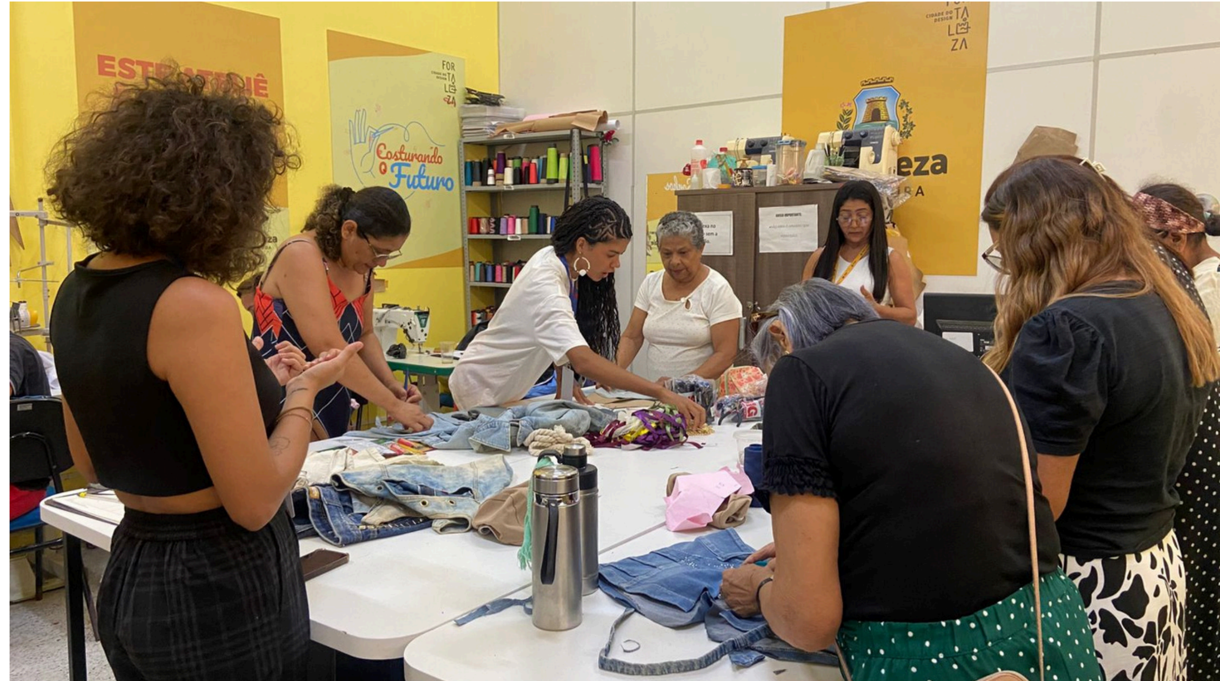
Oficina de upcycling - centro cultural canindezinho