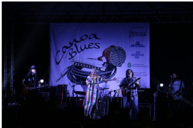
O Canoa Blues acontece entre os dias 15 e 16 de novembro, na praia de Canoa Quebrada