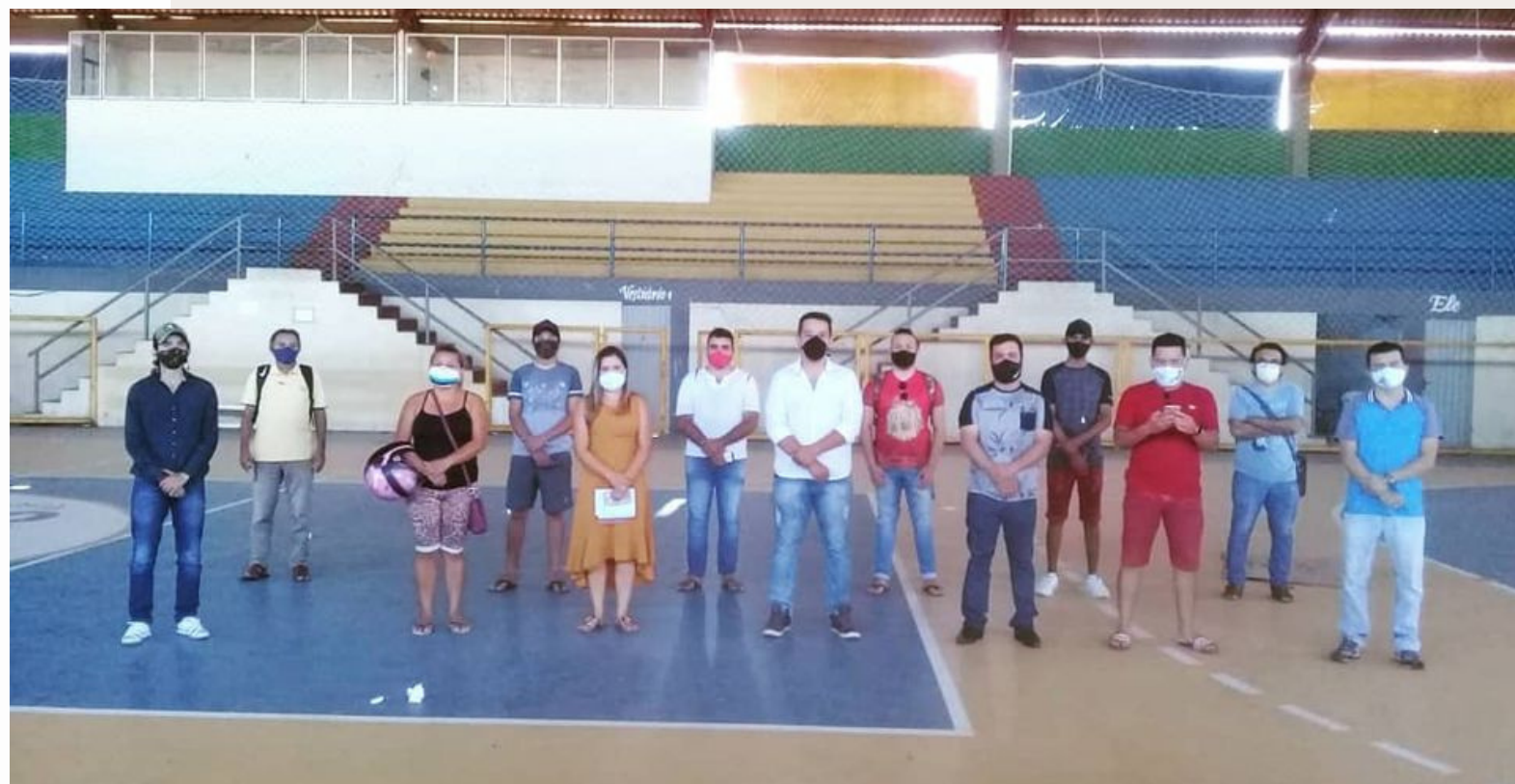
Dia da Posse do Conselho Municipal de Crateús - 2020

Estabelecer um ambiente inclusivo e favorável para os artistas da nossa comunidade. Reconheço o papel crucial que os artistas desempenham na construção da identidade cultural e no enriquecimento de nossa cidade.