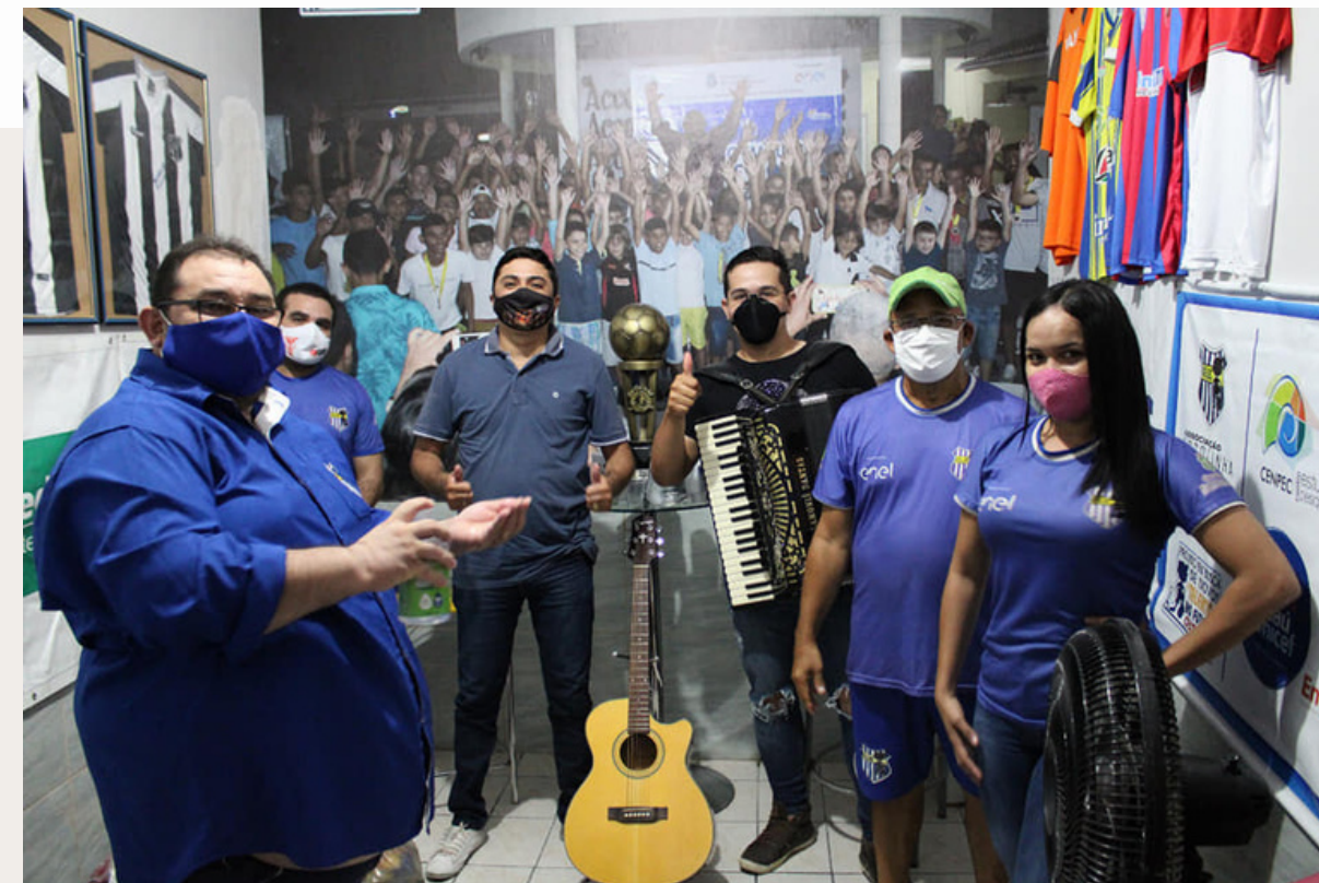
2019 Ação solidária cultural/social ASSEJOC para arrecadação de alimento para doação.

Aos poucos, compartilhar meu amor pela música se tornou tão natural quanto respirar. Juntei-me a grupos locais, aprendi com músicos talentosos e explorei novos estilos. Cada acorde trocado, cada história compartilhada, foi uma lição em gratidão e humildade.