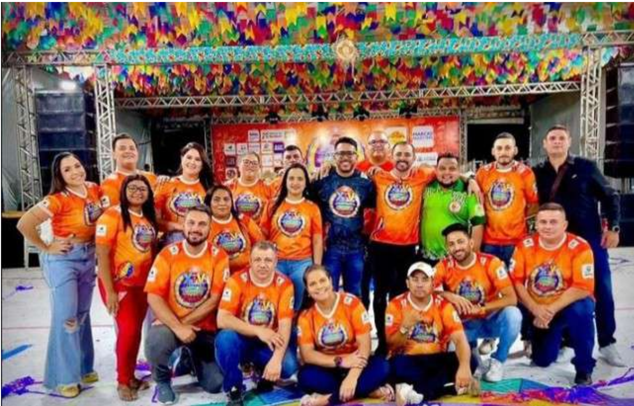
XIV FESTIVAL DE QUADRILHAS DO JARDIM AMÉRICA