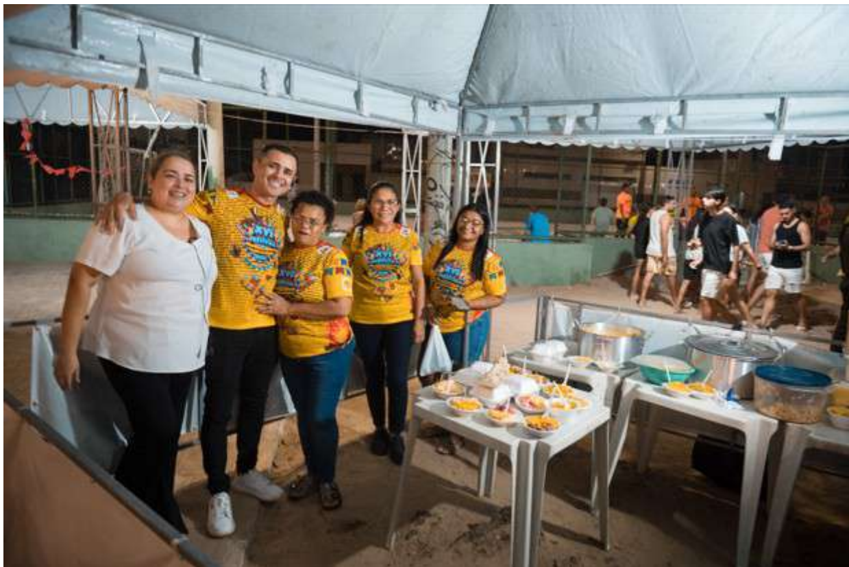
XVI FESTIVAL DE QUADRILHAS DO JARDIM AMÉRICA