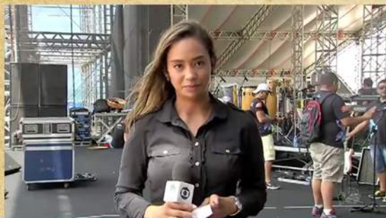
CE 1ª Edição - Reveillon de Fortaleza 2017