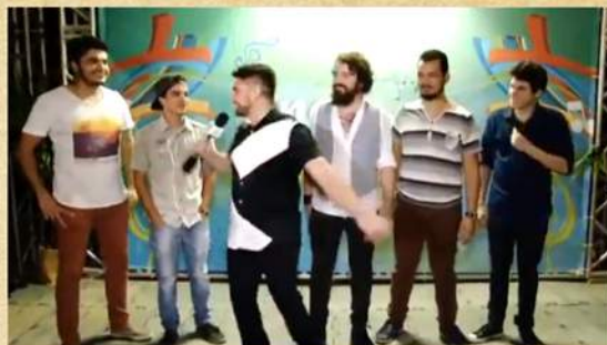
Se Liga Verdes Mares - Encanta Ceará

http://g1.globo.com/ceara/cetv-1dicao/videos/t/fortaleza/v/festa-do-reveillon-de-fortaleza-tera-esquema-especial-de-seguranca-e-transito/5546126/