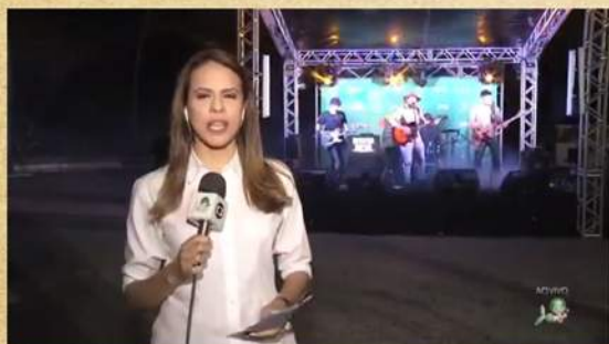
Ação Verdes Mares - Messejana

http://g1.globo.com/ceara/cetv-1dicao/videos/t/edicoes/v/confira-as-12-atracoes-do-encanta-ceara-2017/5604387/