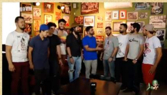
Participação Se Liga Verdes Mares

http://g1.globo.com/ceara/cetv-2dicao/videos/t/edicoes/v/acao-verdes-mares-e-realizada-no-bairro-messejana/5443985/