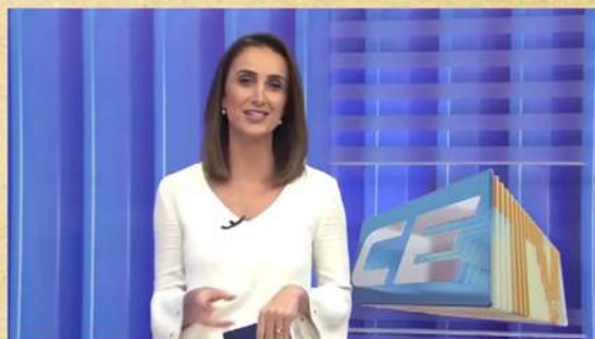
Participação Encanta Ceará

http://cnews.com.br/video/play/20096/programa_arrasou_entrevista_pablo_mendes