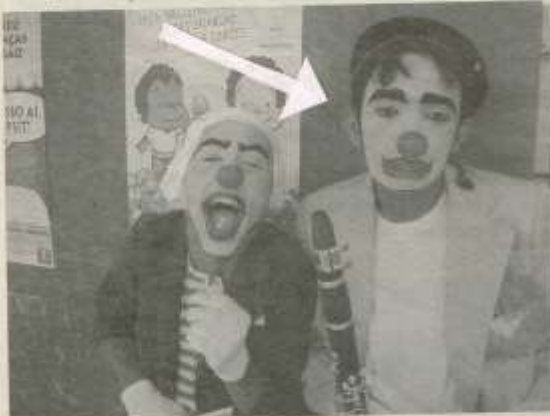
Apresentação do Grupo Fiapo de Trapo

Em solenidade realizada dia 17 de Agosto no Ginásio Coberto do Centro Educacional Municipal, a Administração Municipal de Cascavel lançou a campanha do Selo Unicef-Município Aprovado.