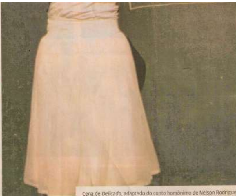
Cena de Delicado, adaptado do conto homônimo de Nelson Rodrigues