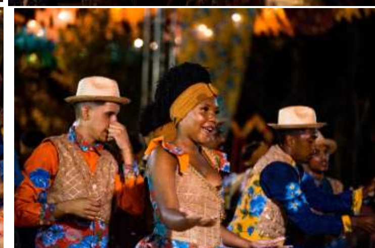
Desenvolvimento do Projeto “RIACHOS, LUTAS E QUILOMBOS – RESISTÊNCIA E UNIÃO” AFROJUNINA da comunidade Quilombola da Base em Pacajus