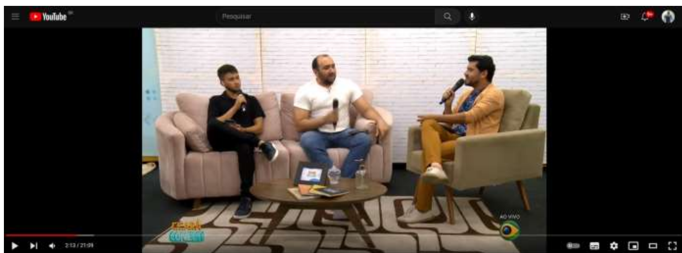
Programa Ceara Connect 24.01.2023

Divulgação da Escola Maloca das Artes: https://www.youtube.com/watch?v=mr_DFyJh_xA