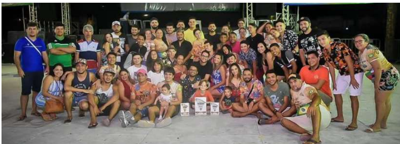
Projeto Campeão Cearense 2019