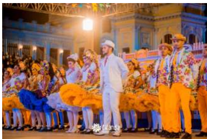
Projeto Campeão Cearense 2022 – Indo para Campeonato brasileiro